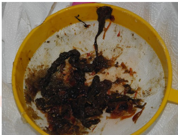
Pasożyty, złogi i kamienie kałowe.