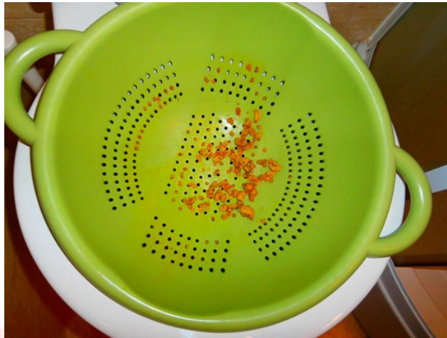
Efekt oczyszczania wątroby.