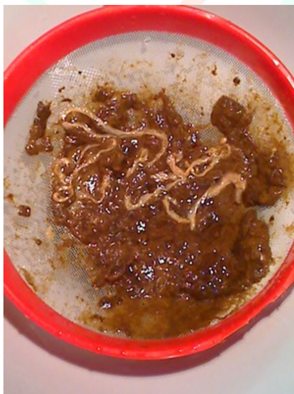
Pasożyty. Po opuszczeniu organizmu były jeszcze żywe i się ruszały. Jak widać ich długość wynosi ok. 20 cm.