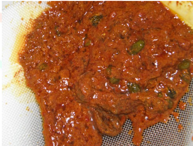
Efekt oczyszczania wątroby.